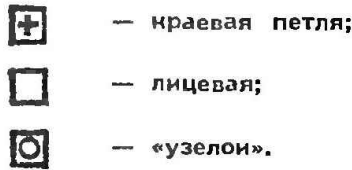
Схема вязки конетки:

Изнаночные ряды выполняются изнаночными петлями.