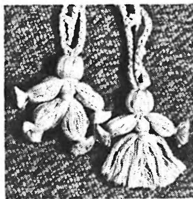
Матрешки на концах пояса.

38-й ряд: обвяжите низ юбки фестонами — в промежутке ракушки между 1 и 2 столбиками с 3 накидами свяжите столбик без накида, 4 воздушные петли и снова столбик без накида, в следующий промежуток свяжите столбик без накида, далее в промежуток еще один фестон. Так обвяжите всю ракушку, на каждой из них должно получиться по 5 фестонов. Между ракушками провяжите столбик без накида.